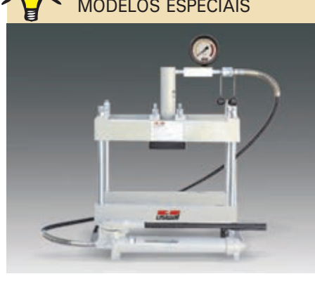
Tabela de seleção