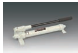
A melhor opção de bomba manual

Cilindros de simples ação, retorno por mola, de pouca altura, são ideais para aplicações com restrições de