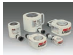
Cilindro Compacto CBM

Cilindros de simples ação, retorno por mola, de pouca altura, são ideais para aplicações com restrições de